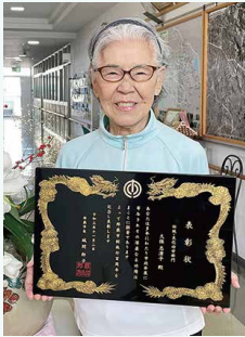
久保先生、おめでとうございます！

車いすダンスを通して、車いすの利用者や高齢者、健常者が楽しく交流しながら活動しています。