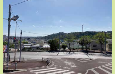
今は交差点ですが、昔は急なヘアピンカーブでした。

沖縄大学に進学して、国場にアパートを借りて始まった沖縄生活も 20 年を超えました。沖縄大学へと続く国場の坂道は、若い頃の私を思い出させてくれる、私にとってのカントリーロードです。