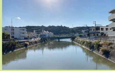
ゆったりした流れと丘の緑は、眺めているとホッとします。 ね。

川辺があり、住宅街があり、丘を巻く坂の道がある。国場は、スタジオジブリのアニメーション映画、「耳をすませば」の舞台に似た感じがしませんか？私だけですか