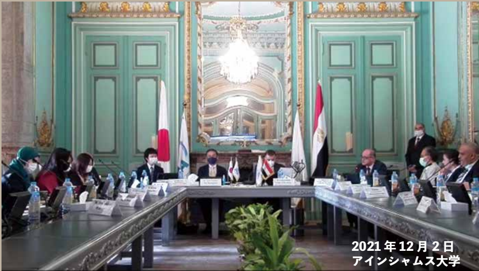
2021年12月2日 アインシャムス大学