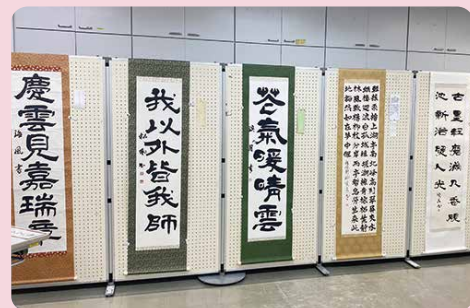
書道サークル大倫