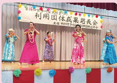
フラサークルハーブナベ