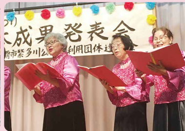
合唱団コールフロイデ