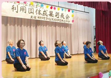
自彊術体操・自彊術健康体操

2月12日(日)、今年度2回目の公民館まつりが開催されました！ 舞台の部に15団体、展示の部に4団体に参加しました。出演のみなさんも、観客のみなさんも祭りならではの熱気を満喫して盛り上がりました！