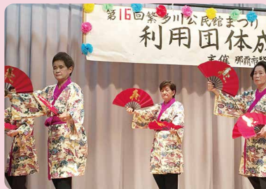
繁多川民踊サークル