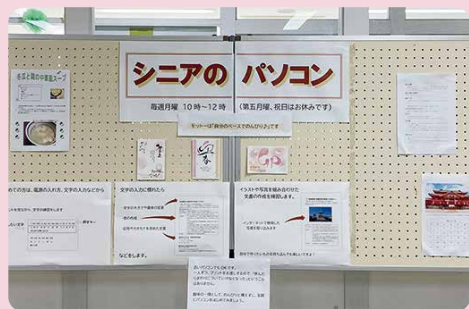
シニアのパソコン