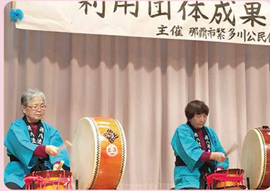
繁多川太鼓同好会

2月12日(日)、今年度2回目の公民館まつりが開催されました！ 舞台の部に15団体、展示の部に4団体に参加しました。出演のみなさんも、観客のみなさんも祭りならではの熱気を満喫して盛り上がりました！