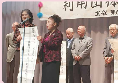
繁多川ゆんたく会