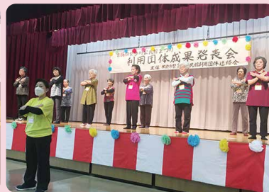
繁多川ふれあいデイサービス