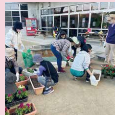
緑化活動のようす

2月1日の緑化活動や事前準備にもたくさんの参加があり、交流を楽しみながら和気あいあいと作業を行いました。みなさんの自発的なご協力によって、公民館まつりが無事に終わられたことをあらためて感謝いたします。次年度もますます活気あるまつりにしていきましょう！