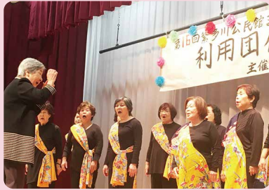
ひばりが丘女声コーラス