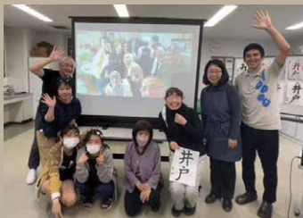
参加者全員の集合写真