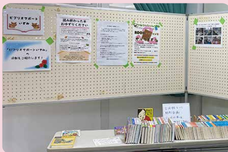
ビブリオサポートいずみ