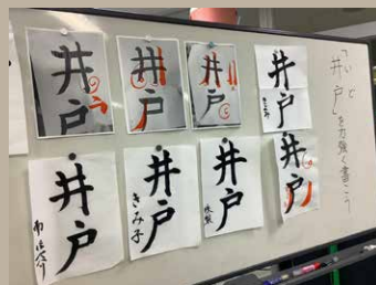
両国の参加者の作品を、先生に添削して頂きました

また、「エジプトとこんなことをやってみたい」「こんなことが知りたい」などのリクエストも大歓迎です。