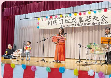
Three Leaf Clover