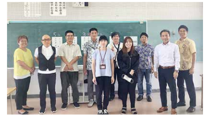
さまざまなお仕事をされている講師のみなさん

地域の企業人が講師となってお話するキャリア教育が石田中学校 (7/7)、寄宮中学校 (7/14) で行われ公民館がコーディネートしました。各校 10 名以上の講師陣の協力の元、生き方、人生の岐路を生徒が学ぶ機会となりました。