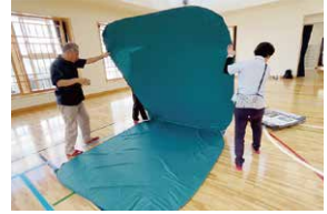
私たち地域住民にできることは？