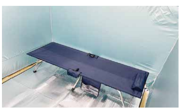
避難所ってどんなところ？