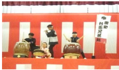
<和太鼓雷塾村田兄弟妹>