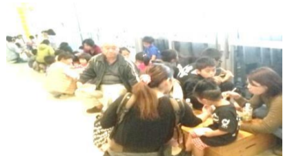
<美味しいお餅をパクパク>