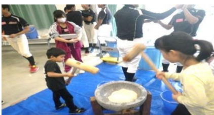
<頑張ってお餅をつくぞー!>