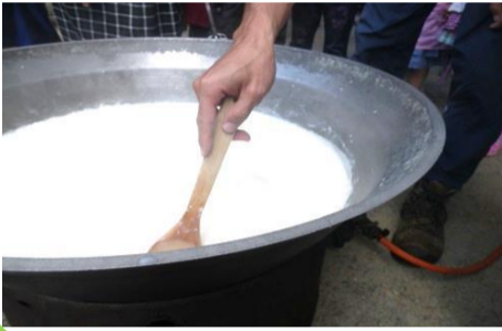
<豆腐が生まれました!!>