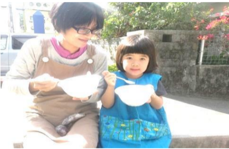
<とっても美味しいです>