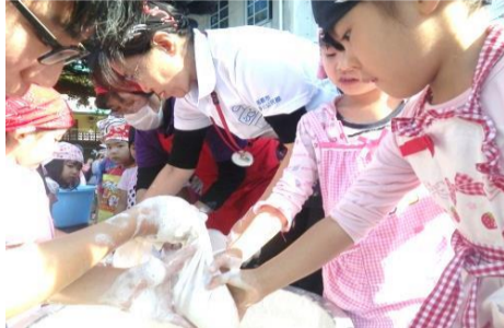
<頑張っしてぼります!>