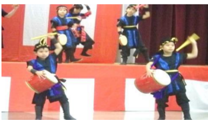
<繁多川子ども会 はばたき>